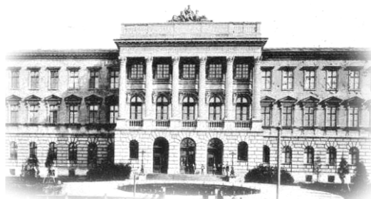
Головний корпус Львівської політехніки

Національний університет "Львівська політехніка" Колегія та профком студентів і аспірантів Рада молодих вчених